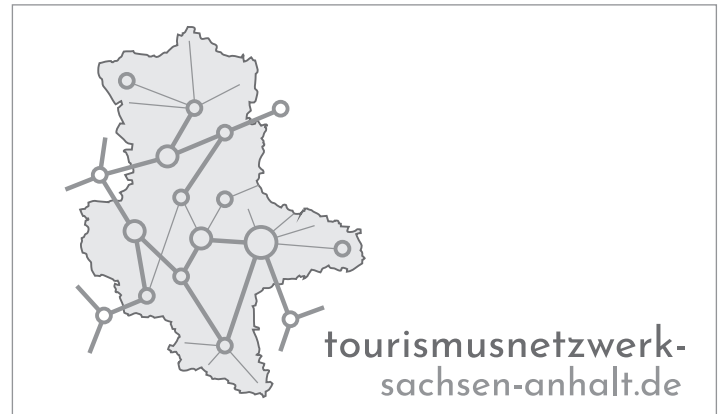
Das Logo ohne Farbe für Print in Graustufen, für Web in Graustufen