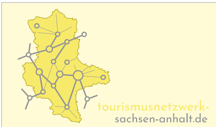
OK: auf hellen pastelligen Untergründen