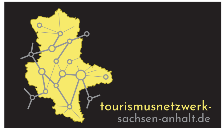
OK: auf Schwarz