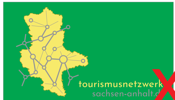
NICHT OK: auf mitteltönigen Untergründen

Josefin Sans (Schriftart des Claims im Logo)