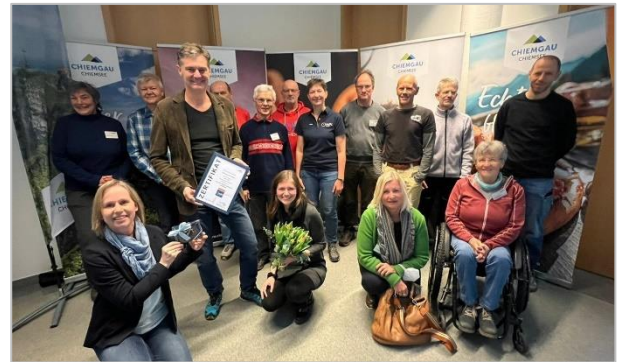
Urkundenübergabe in der ADFC-RadReiseRegion Chiemsee-Chiemgau

Aufgrund der Pandemie konnte auch in diesem Jahr die Urkundenübergabe für die vom ADFC ausgezeichneten Radfernwege und Regionen nicht wie geplant auf der ITB stattfinden. Eine persönliche Übergabe ließ sich der ADFC jedoch nicht nehmen und reiste stattdessen in die Regionen vor Ort. Vielen Dank für den herzlichen Empfang!