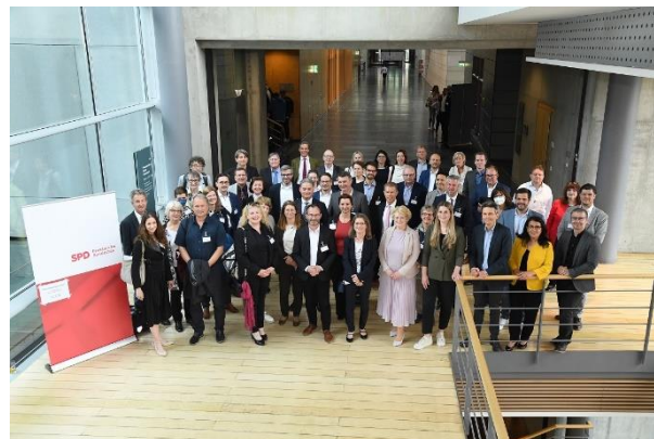
Tourismuspolitischer Dialog

Am 10.05.2022 lud die SPD-Bundestagsfraktion touristische Spitzenverbände zum tourismuspolitischen Dialog in den Bundestag. In Gesprächen mit den Abgeordneten und dem tourismuspolitischen Sprecher Stefan Zierke konnte der ADFC die Bedeutung des Radtourismus, auch für den Alltagsverkehr, verdeutlichen.