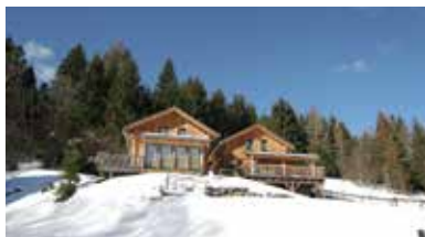
Stadl an der Mur, Steiermark, Austria - AT-8862-05