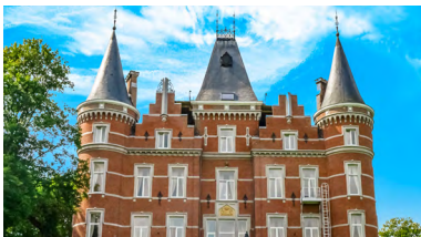
Namur, Belgien, BE-0024-91