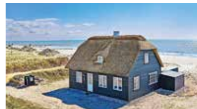
Jütland, Syddanmark, Dänemark - 82298