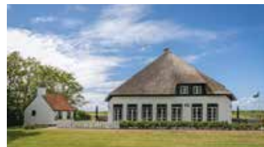
Niederländische Küste, Texel, Niederlande - NL-1795-43