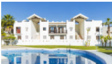
Andalusien, spanische Küste, ES-00030-73