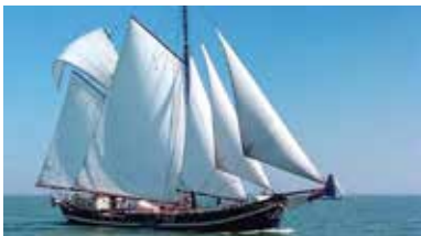
Südholland, Niederlande - NL-2315-01