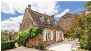
Mittelfrankreich, Dordogne, Frankreich - FR-00003-50