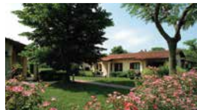
Sirmione, Italienische Seen, Italien - IT-25019-12