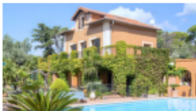
Provence, Frankreich, FR-83600-34